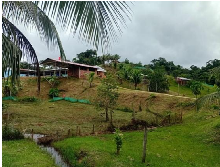
Terrain de Casa Hogar

Casa Hogar "mi refugio", Caretera Iquitos –Nauta, à 75,8km d'Iquitos +519 539 902 281