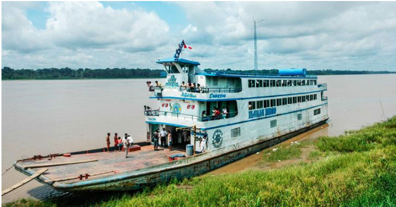
Arrivée en bateau à Iquitos