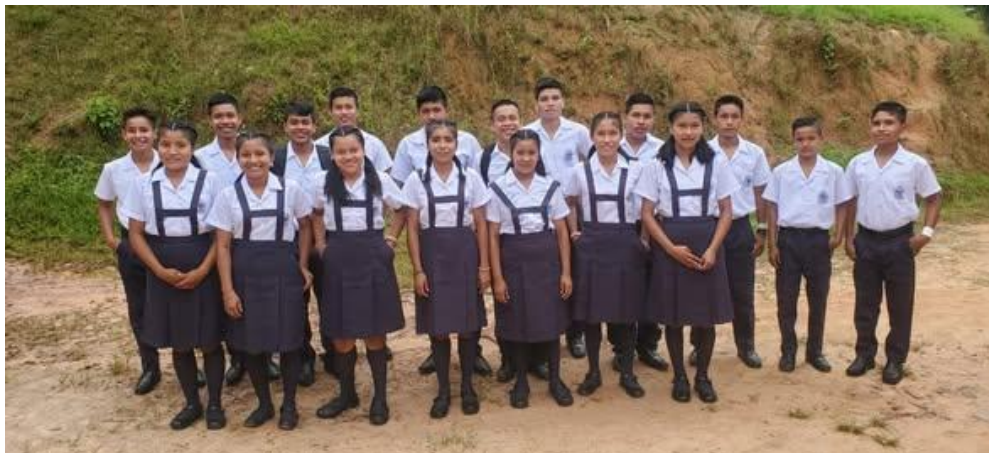
Rentrée scolaire des enfants de Casa Hogar