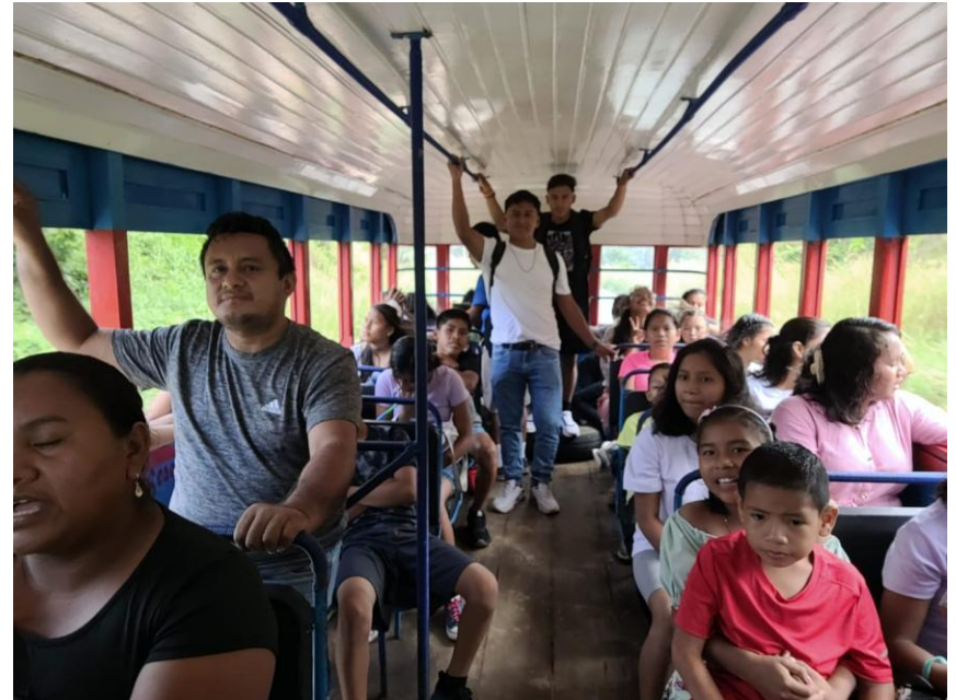
Sortie scolaire en bus