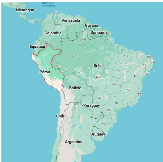
Pérou en Amérique latine