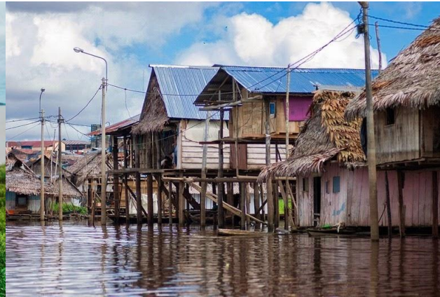
Maisons au bord du fleuve